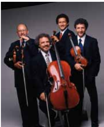
Sergio Yazbek ©