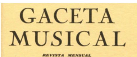
Revue musicale éditée par Manuel M. Ponce. Paris, 1928.

en espagnol avec traduction consécutive en français