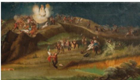
Ex-voto dédié à María Santísima del Rosario (Anonyme), 1877.