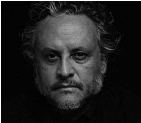
Dix minutes dans le noir, 2009

Du 15 septembre 2010 au 3 janvier 2011 Centre Georges Pompidou