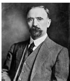
Francisco I. Madero

Mardi 5 octobre Salons Albert Mollat • Bordeaux