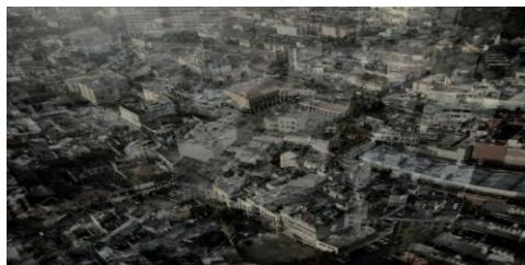
Gerardo Suter Pénultième région Jet d'encre sur papier coton 50 x 100 cm hors tout 2009