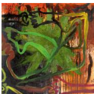
MIGUEL ALEJANDRO MORENO LUQUE Sans titre Mixte sur toile 120 x 120 cm