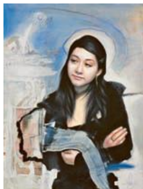
LUIS ALBERTO MONTALVO SALAZAR Intervention de l'abstrait Mixte sur toile 80 x 60 cm