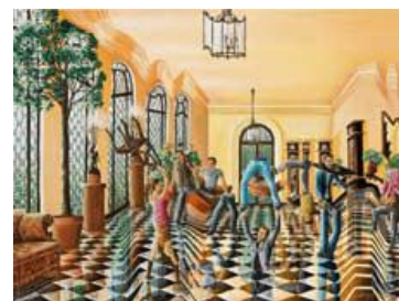
JOSE RICARDO MARTINEZ PERALES Transformers Huile sur toile 100 x 135 cm