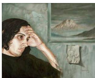
ROBERTO MARTINEZ SALDIVAR Message posthume Huile sur bois 90 x 110 cm