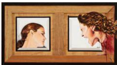
CARLOS ENRIQUE ROBLEDO MORENO Méduse et Médée Acrylique sur bois 53 x 97 cm