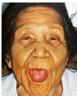
ROBERTO CARLOS TREVIÑO RODRIGUEZ La-la-lère Huile sur toile 200 x 160 cm