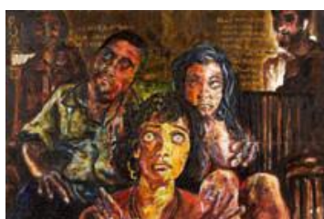
JOEL LUNA MEDRANO Éducation familiale Acrylique sur toile 100 x 160 cm