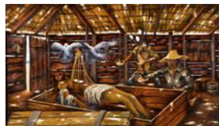
JUAN PABLO VILLARRUEL CASTELLANOS Sans titre Huile sur toile 70 x 120 cm

« Je travaille autour des vices psychologiques émanant de l'activité créatrice: le ras-le-bol stylistique et l'autocastration créative. Fantômes qui couronnent l'artiste et sont alimentés par l'histoire de l'art et le symptôme du «no future». Cette idée apocalyptique se traduit sous la forme de scènes picturales aussi ravaudées que le cadavre de l'histoire interminable des «-ismes» et leur complexité superficielle dans le cadre de la vie quotidienne, les vices et le bombardement d'images auquel sont soumises les grandes villes. Elle construit des images répétées comme autant de tâches subversives d'une activité artistique qui se limite à faire partie de constructions inspirées par l'art outsider et la science-fiction, gâchettes qui déclenchent, comme une bouffée d'air, le besoin de bizarrerie dans la vie de tous les jours, bien que l'image rappelle l'énorme absurdité de l'existence urbaine. Je travaille actuellement autour de l'idée du Frankenstein de Mary Shelley, du monstre en tant qu'unité sociale et historique, et de la responsabilité de l'auteur vis à vis de son œuvre ».