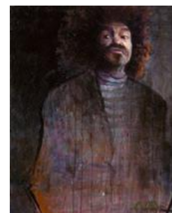
JORDI MICHEL MARIN GEST Sancho Mixte sur toile 80 x 60 cm