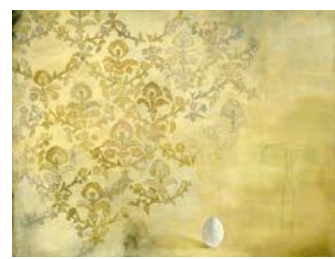
LORENA MARIA CAMARENA OSORNO Nature morte à la tapisserie Acrylique sur toile 60 x 80 cm