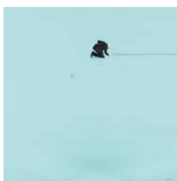
JIMENA RINCON PEREZSANDI Chalk Acrylique sur toile 120 x 120 cm