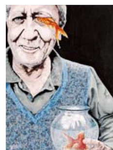
MICHELE DE ALBA DE LA PEÑA Le fou aux poissons Mixte 80 x 60 cm