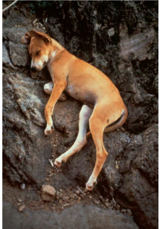
Butterfly Effect 12 1999 Papier imprimé découpé et collé Telenor Art Collection, Fornebu, Norvège © Gabriel Orozco