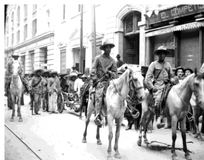
Auteur non identifié Cavalerie constitutionnaliste, vers 1915 Négatif sur verre à la gélatine Fonds d'archives Casasola. Photothèque Nationale Institut national d'Anthropologie et d'Histoire, Mexique (INAH)