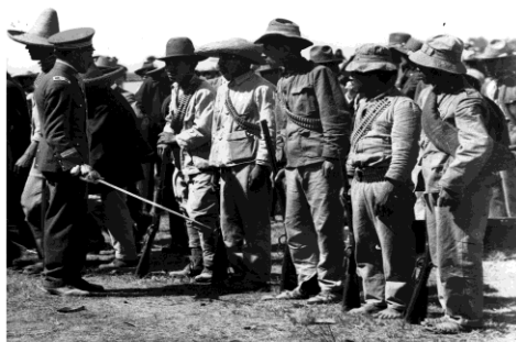
Auteur non identifié Recrues constitutionnalistes avec l'Armée fédérale, vers 1915 Photographie originale tirage gélatine-argent Fonds d'archives Casasola. Photothèque Nationale Institut national d'Anthropologie et d'Histoire, Mexique (INAH)