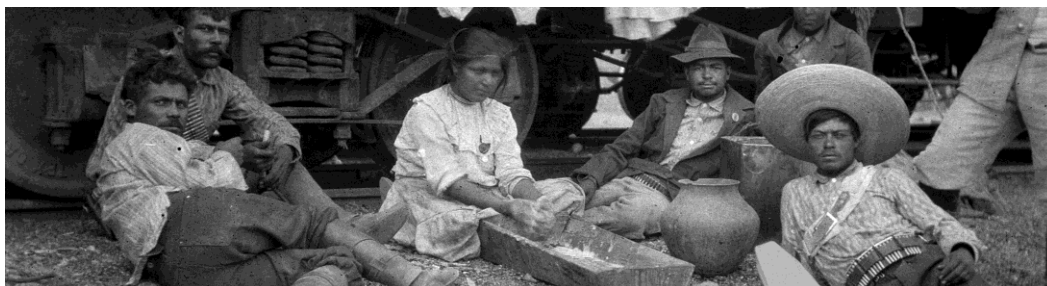
Auteur non identifié Forces de Lucio Blanco, vers 1914 Négatif original sur pellicule en nitrate Fonds d'archives Casasola. SINAFO-Photothèque Nationale Institut national d'Anthropologie et d'Histoire, Mexique (INAH)

Visuels haute définition [disponibles sur demande]