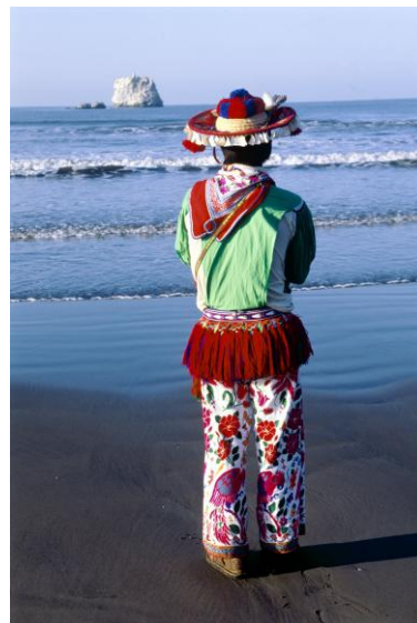
Huichol à Haramatsie Sanctuaire de Nuestra Madre el Mar, 1998